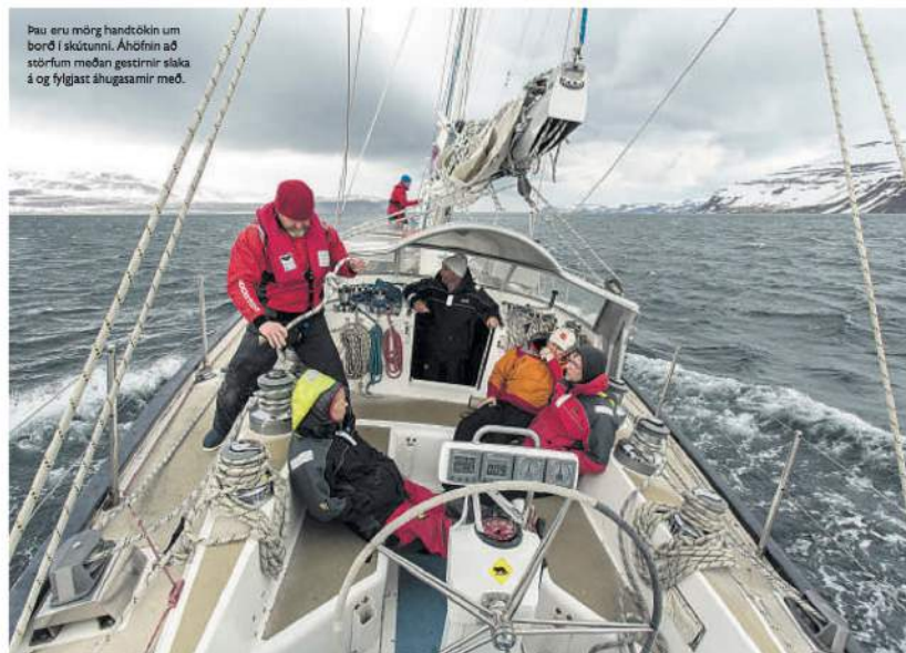
Þau eru mörg handtökin um borð í skútuinni. Áhöfnin að störfum meðan gestirnir slaka á og fylgjast áhugasamir með.