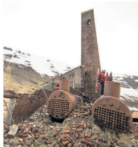
Hvalstöðin á Stekkeyri, sem löngu er farin í eyði, er mikið mannvirki. Norðmenn reistu hana.

✿ Hann hafði vist á orði að þetta væru bestu dagar sem hann hefði upplifað – án símans.