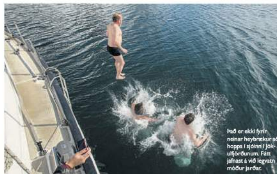
Það er ekké fyrir neinar heyrbrækur að hoppa í sjóinn í Jökulfirðinum. Fæst jalfnast á við legvatn móður jarðar.