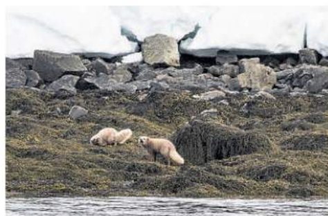
Talsvert dýralíf er í Jökulfirðinum, ekki síst fuglar og refir. Þessir refir brostu við ferdalöngum.

✿ Hann hafði vist á orði að þetta væru bestu dagar sem hann hefði upplifað – án símans.