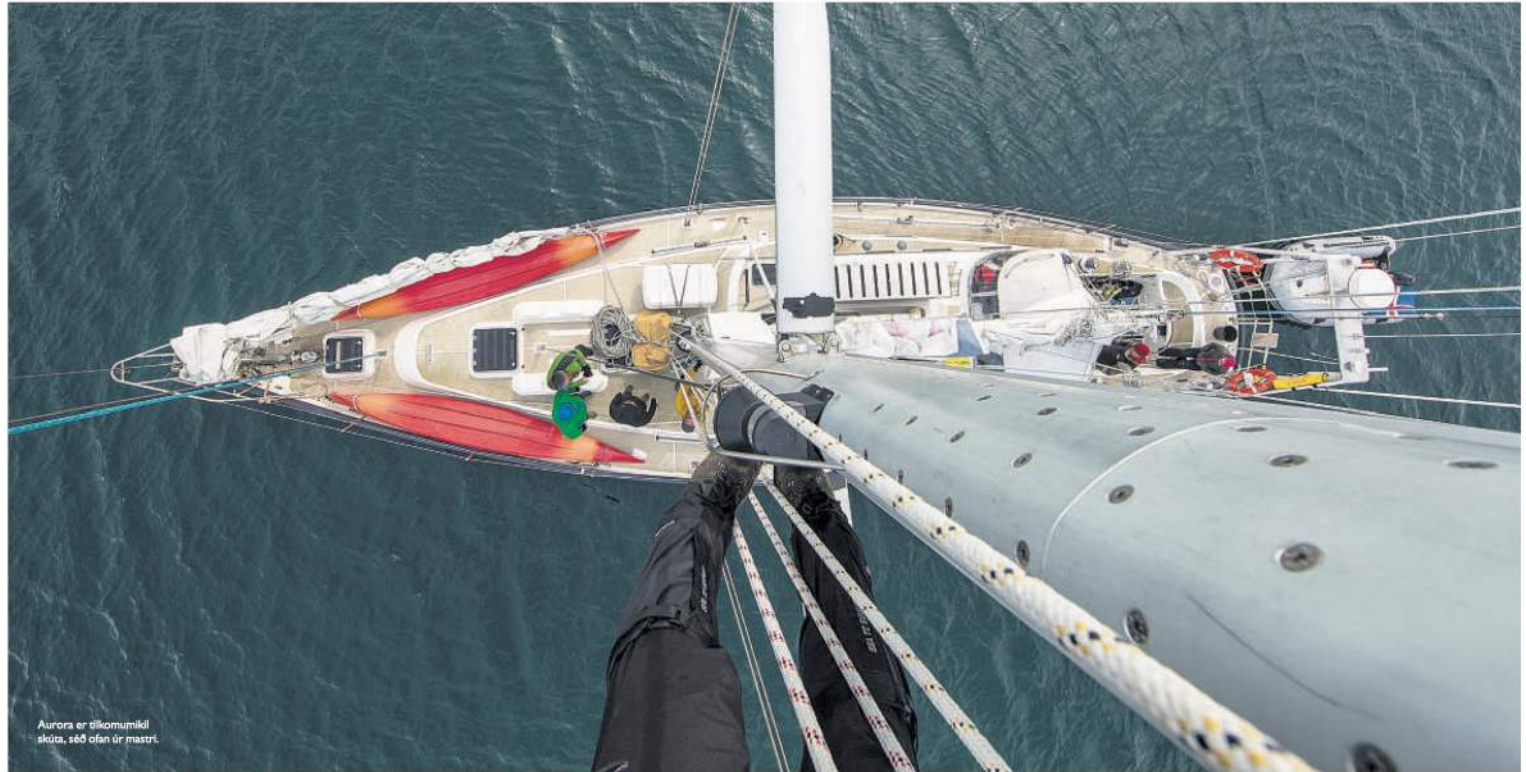
Aurora er tilkomumikil skúta, séð ofan úr mastri.