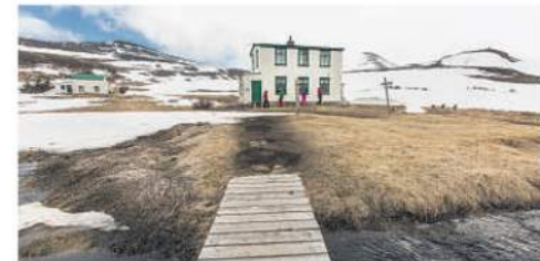
Gamli leknibústaðurinn á Hesteyri er reisulegasta hús. Langt er síðan þorpið lagðist í eyði.