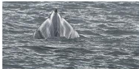
Þessi hnúfubakar lét á sér kræla meðan á siglingunni stóð. Hann er engin samíðli.