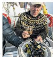
Kræklingur var á borðum síðasta kvöldið.